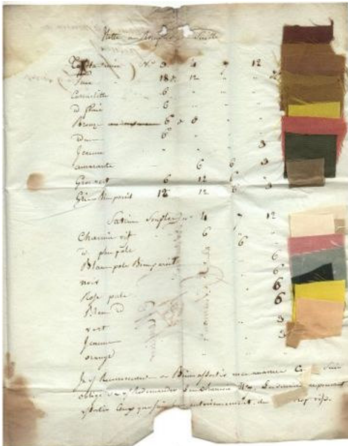
Courrier manuscrit en date du « 21 frimaire an 12 » ( 13 décembre 1803) un artisan y présente sa collection de tissu.(partie gauche)